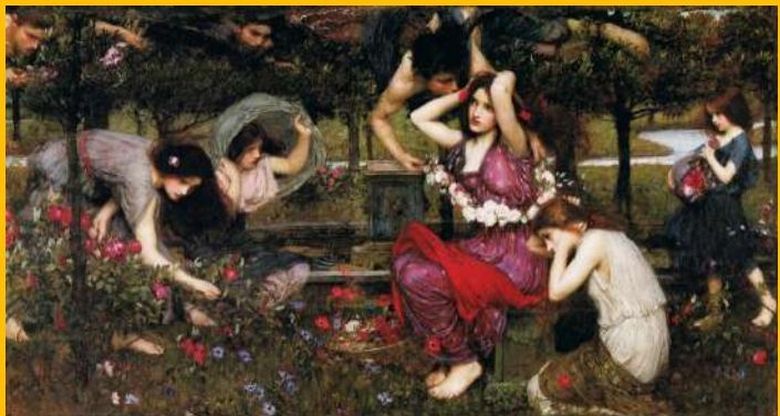
Flora and the Zephyrs - John William Waterhouse

Ο μύθος λέει ότι κάποτε ο θεός άνεμος Ζέφυρος ερωτεύτηκε τη Νύμφη Χλωρίδα. Από την αγάπη αυτή γεννήθηκαν όλα τα λουλούδια της άνοιξης. Από τότε, κάθε χρόνο η αγάπη τους ξαναγεννιέται και χαρίζει χρώματα και ομορφιά σ' όλη τη γη.