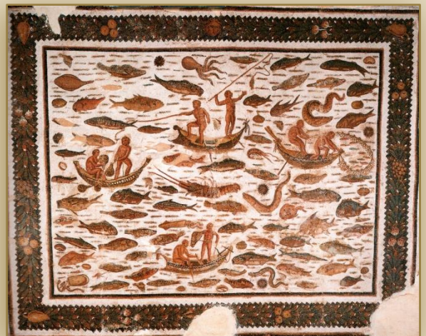
Ρωμαϊκό ψηφιδωτό δάπεδο ,Τυνησία Sousse

Τετάρτη 30 Οκτωβρίου 2019 , στο Αμφιθέατρο του Μουσείου και ώρα: 19:00 .